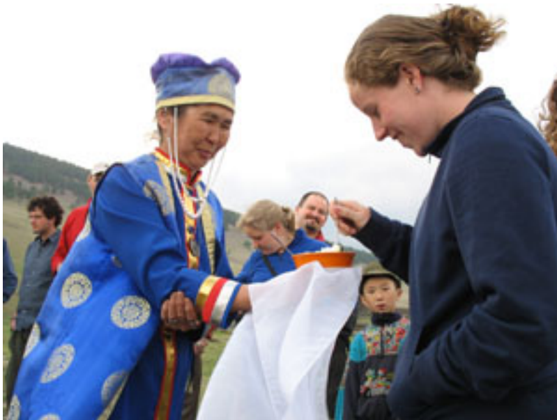
Дегустация традиционных бурятских угощений (позы, саламат, бухлер и др.)